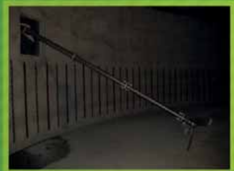
Multimix 1m20 de diamètre - bras long 6m50, idéal pour niveau variable et pré-fosse