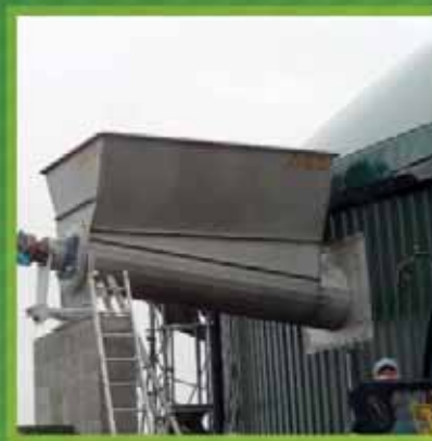
Trémies d'alimentation - INOX de 10 à 40 m 3 de capacité