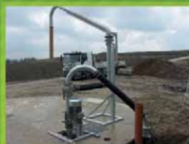
Pompes, stations de pompage et de chargement