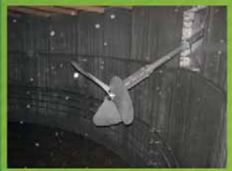
Mammut 1m60 de diamètre - idéal pour taux de MS élevé, brassage en profondeur