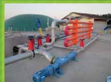
Pompes dilacératrices, échangeurs Bio-Heat