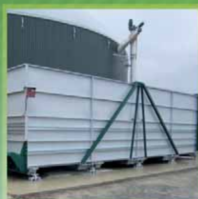
Fonds mouvants - INOX de 20 à 200 m 3 de capacité