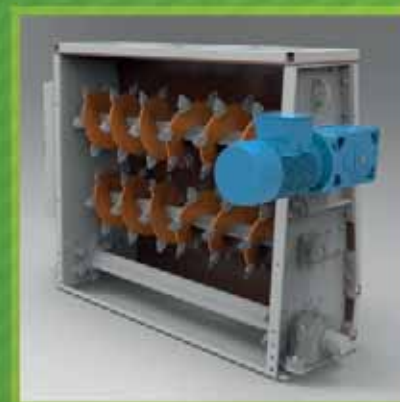
Trémies doseuses - avec racleurs à chaînes de 12 à 60 m 3 de capacité